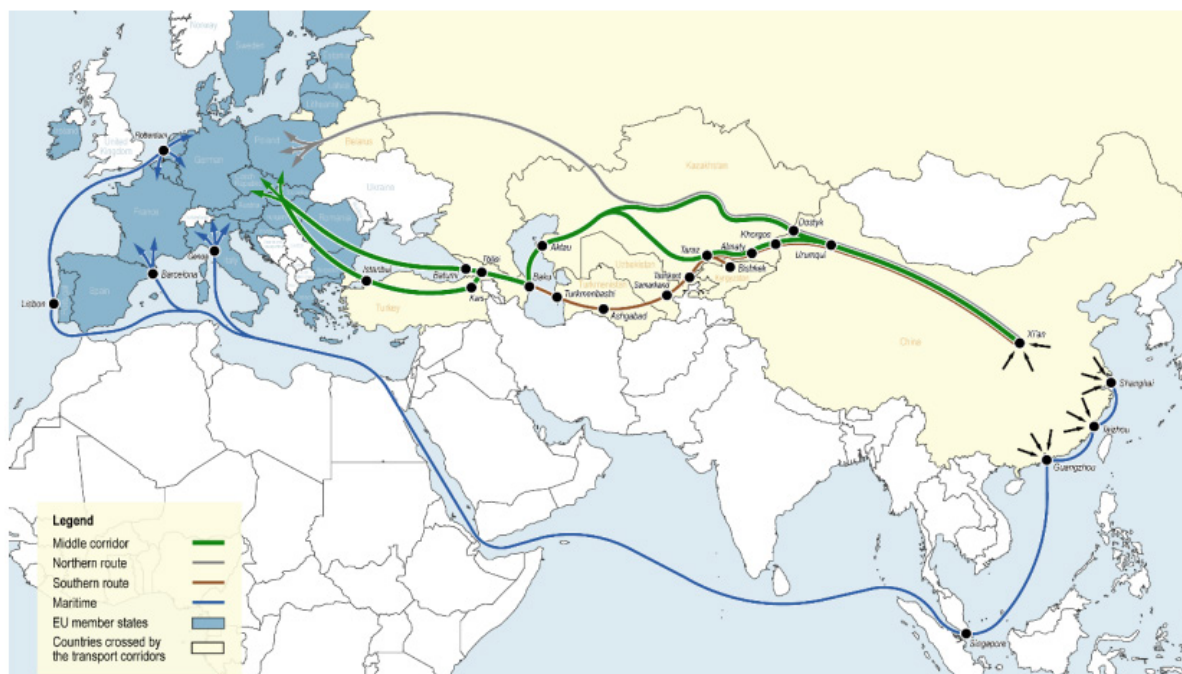
Figure ES1. The MC among trade corridors connecting Europe and Asia