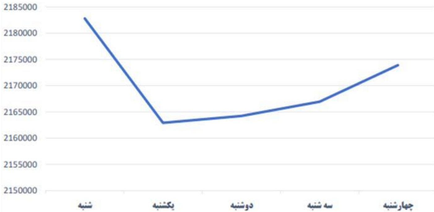
تغییرات شاخص کل از ۲۷ تا ۳۱ خرداد

شاخص کل ابتدای هفته در کانال دو میلیون و صد هزار واحد آغاز به کار کرد و شروع پر عرضه ای را داشت و با خبر گزارش خودرویی ها وضعیت بازار بد بود و تقریبا حالت کما رفته بود و ارزش معاملات به شدت پایین آمده است و همین عامل باعث رکود در بازار شده است و شرایط حال بازار با شرایط ایده آلی که در دو ماه اول سال قرار داشت فاصله دارد و ورود پول حقیقی خاصی هم