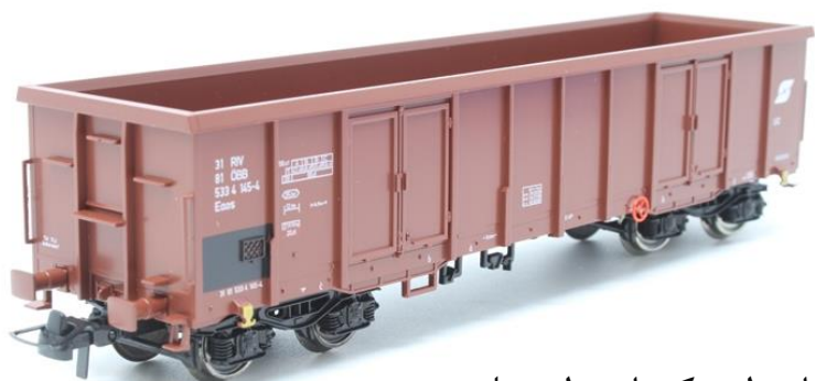
واگن‌های لبه کوتاه و لبه بلند: حمل آهن‌آلات و مصالح ساختمانی