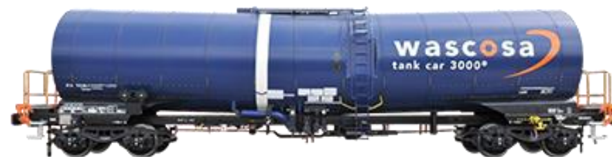
واگن مخزنی: حمل سوخت و انواع مایعات