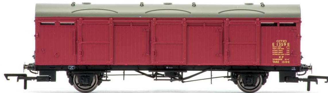
واگن مسقف: حمل کالاهایی که آسیب‌پذیرند